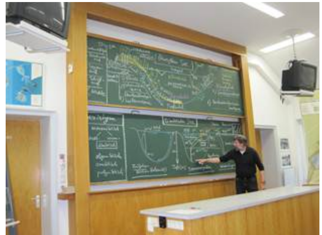
Abb. 8 Herr Pust erläutert Schichtung und Zonierung eines Gewässers am Beispiel des Heiligen Meeres.

kennengelernt hatten, wurden zu- und eingeordnet. Die oberste Wasserschicht wird Epilimnion genannt, in welcher in einem eutrophen See sehr viel Sauerstoff vorhanden ist, in der untersten Schicht (Hypolimnion) jedoch fast gar keiner. In einem oligotrophen See ist allerdings der Sauerstoffgehalt in dem Epilimnion ungefähr gleich dem Sauerstoffgehalt des Hypolimnions.