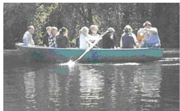
Abb. 5 Planktonfischen auf dem Heiligen Meer

Nachdem wir nun die Uferzonen ausführlich erkundet hatten, fuhren wir mit kleinen Ruderbooten auf den See, um Wasserproben zu nehmen (Abb. 5). Anschließend untersuchten wir diese nach kleinsten Lebewesen, also Planktonorganismen, und entdeckten eine ganze Vielfalt uns bis dahin unbekannter Lebewesen (Abb. 6). Mithilfe eines Bestimmungsbuches konnten wir sie benennen und verschiedenen Artengruppen zuordnen.