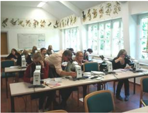
Abb. 6 Im Kurssaal bestimmten wir die Planktonorganismen