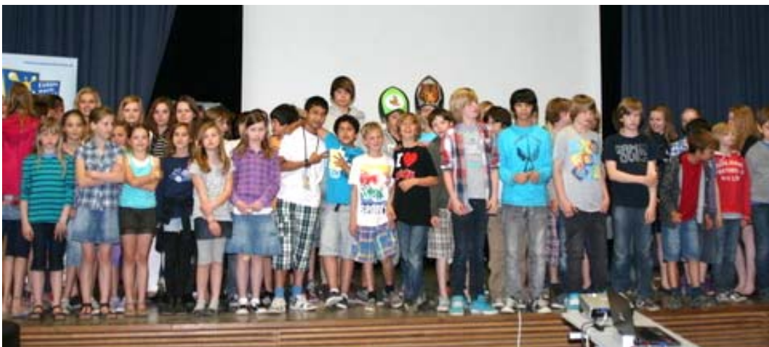
Westfälische Nachrichten, 10.05.2011