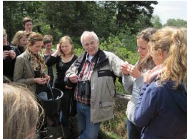
Abb. 4 Der Gagel enthält etherische Öle, die intensiv duften. Mit ihnen wurde früher das Bier gewürzt.

Beispiel Schwimmblattpflanzen, Schilfröhricht und Erlen (Abb. 4).