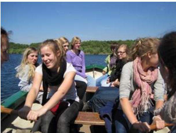
Abb. 10 Rudern auf dem Heiligen Meer