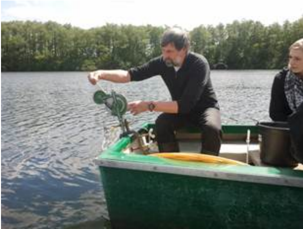
Abb. 9 Bestimmung der Sichttiefe mit der Secchi-Scheibe

Müde, aber um einige Erfahrungen reicher, erreichten wir Münster. Insgesamt war es eine sehr erlebnis- und lehrreiche Exkursion