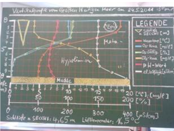
Abb. 11 Sammeln der verschiedenen Parameter zum Heiligen Meer