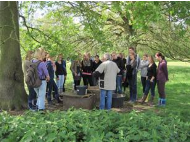
Abb. 3 Das Grundwasser eines verlassenen Brunnens wurde untersucht.

So wächst zum Beispiel der Gagel an weniger nährstoffreichen Gewässern, während an nährstoffreicheren andere Pflanzen gedeihen können, wie zum