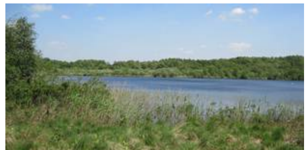
Abb. 1 Heiliges Meer mit typischer Ufervegetation