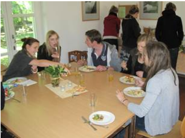
Abb. 7 Abendessen in der Biologischen Station

Am zweiten Tag unserer Exkursion fuhren wir früh am Morgen wieder auf den See, um uns verschiedene Wasserpflanzen der Gewässerrandvegetation des Heiligen Meeres anzuschauen. Dort lernten wir u.a. die gelbe Teichrose und die weiße Seerose in Habitus und in ihren Standortansprüchen kennen. Des Weiteren haben wir erfahren, wie ein Röhrichtgürtel aussieht und welche Bedeutung er hat, also welchen Gewässertyp er z. B. anzeigt.